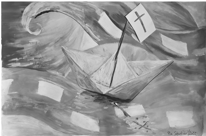
Grafik: Pia Schüttlohr