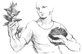
Grafik: Hetty Krist

Aus den Palmzweigen des Vorjahres wird die Asche, mit der wir am Aschermittwoch bekreuzigt werden. Das, womit wir Jesus als Messias begrüßt haben, ist über das Jahr vertrocknet und wird deshalb zum Zeichen der Buße und Umkehr – damit wir Christus wieder als unseren Herrn begrüßen.